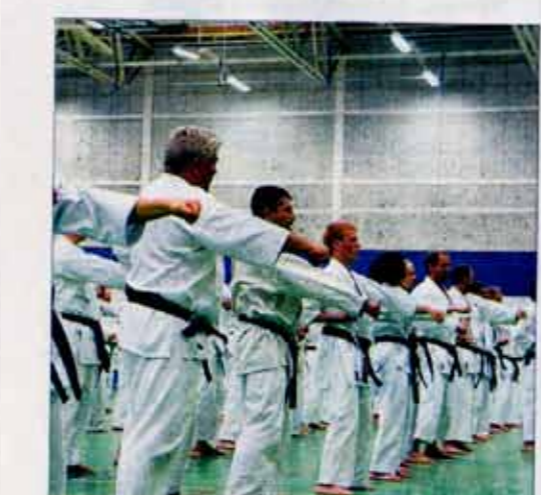
350 karateutövare besökte Bosön i förra veckan.

Karate De fyra stora stilarna inom karate är Shotokan, Goju-ryu, Shito-ryu och Wado-ryu. Karate betyder "tom hand" och står för "vapenlös" eller "fredlig stil". Inom de japanska kamparterna finns det både elevgrader (kyu-grader) och mästargrader (dan-grader) som visas utifrån färg på bälten. Elevgraderna, som kan vara mellan tre och tio stycken, börjar med ett vitt bälte. Detta följs sedan med färger som gult, orange, grönt, blått, rött, brunt och lila. Mästargraderna är det som brukar kallas för svart bälte. Det brukar alltså betyda att man får en dan. Efter den första graden av svart bälte kommer fler dan-grader, mellan nio och 15 stycken.