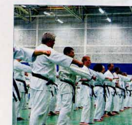
350 karateutövare besökte Bosön i förra veckan.